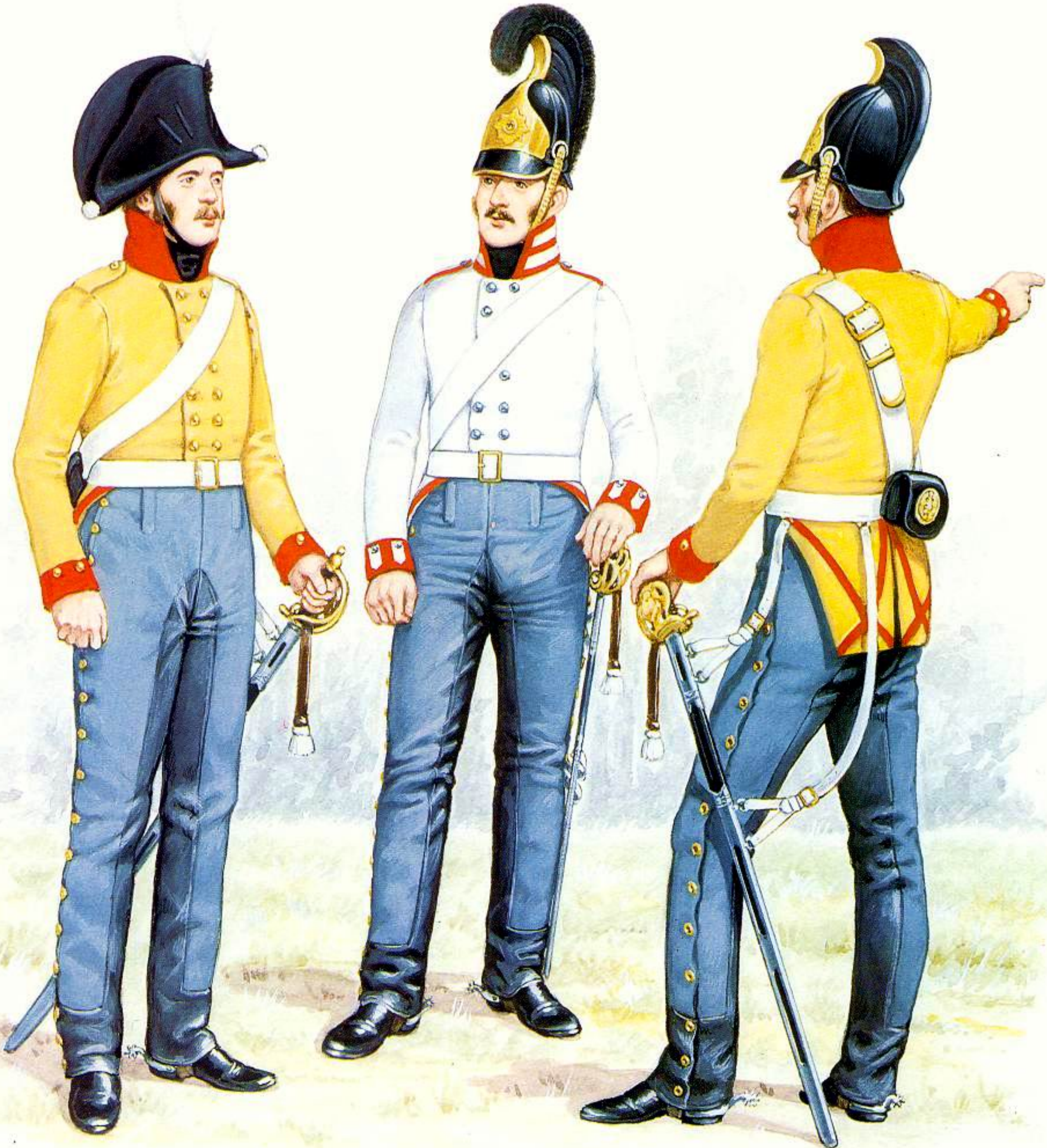
1, 2: Troopers, Brandenburg Cuirassier Regt., 1809 3: Trooper, Regt. Garde du Corps, 1809-13