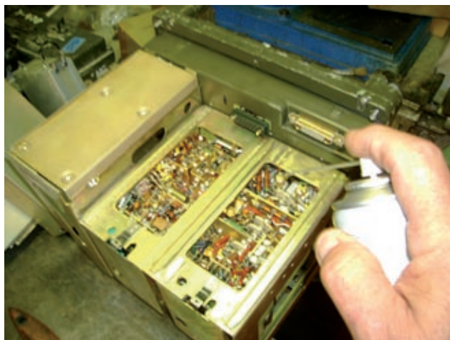
Disossidazione dei contatti

Un Test Set, in valigia d'alluminio stagna contenente il Rosmetro, il Wattmetro, le chiavi speciali per regolare