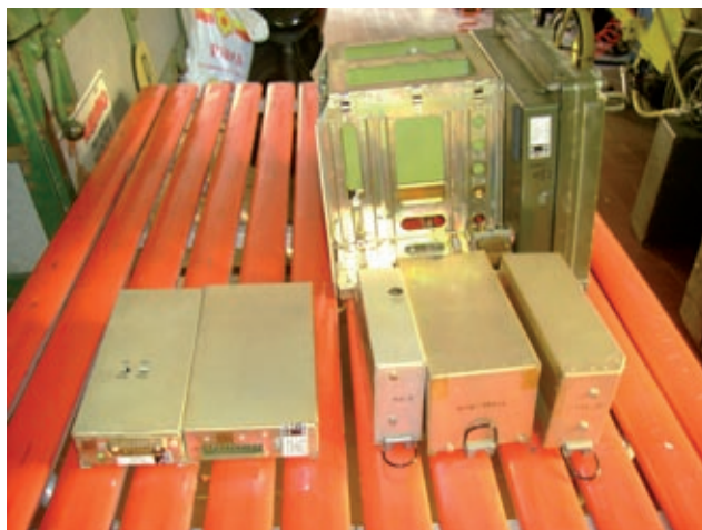
Moduli estratti dal Frame