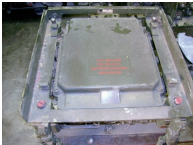
Mounting con alimentatore

Aperte in TRX stando attenti di non rovinare la guarnizione di gomma. Togliete il coperchio all'alimentatore posto nel basamento. Cominciate a togliere uno per volta i moduli e controllatene lo stato. Disossidate con disossidante secco. Indi rimontate il tutto. Lo stesso per i moduli del TRX. Ungete con grasso di vaselina le guarnizioni prima di richiudere il tutto. Ora poniamo che abbiate una antenna risonante (io ho una 5/8 per i 50 MHz), collegate il cavo RF all'antenna oppure a un carico fittizio. Controllate che il commutatore (1) sia su AUS. Collegate il cavo di alimentazione a una sorgente adeguata. Montate su (9) un micro, una cornetta oppure il suo LS-166 (cosa consigliata) Ora portate (1) su KLEIN oppure GROSS (bassa e alta potenza). Sentirete quasi subito il forte soffio della FM. Regolate il volume con (2) e portate (5) su RAUSCH (squelch inserito). Vedrete che la spia (7) si sarà accesa e regolatene l'intensità ruotandola. Ora portate il comando (8) su H. Con il comando (3) impostate i MHz e con il (4) i kHz. Siete pronti per andare in aria! Modulate senza gridare a circa 5 cm dal microfono. Come tutti gli apparati militari, il SEM 25 ha un circuito di Side Tone per l'auto ascolto, pertanto se usate l'altoparlante, vi consiglio di tenere basso il volume. La qualità della modulazione è ottima. Una cosa: dopo l'accensione bisogna aspettare almeno un minuto prima di andare in TX, per dar modo alle valvole di riscaldarsi adeguatamente.