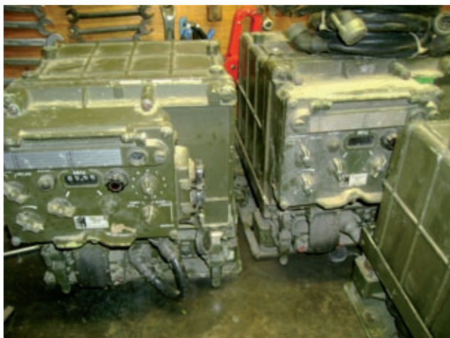
Gli apparati come li abbiamo trovati

dato che era in pratica impossibile togliere in modo accettabile la sporcizia con pennello e straccio, ho preferito una soluzione drastica. Essendo gli apparati completamente Waterproff, ho staccato i TRX dai Mounting, i cruscotti dalle radio e gli ATU dai suoi supporti. Poi messi uno per volta gli apparati in una bacinella di plastica ricavata da una vecchia tanica da kerosene da 20 litri tagliata a metà, ho iniziato a lavare i pezzi con un pennello a setole lunghe e gasolio. Una volta che il gasolio aveva lavato per bene, ho portato tutto in giardino e li ho sciacquati con un potente getto d'acqua. Poi li ho asciugati con aria compressa. Risultato: è da vedere nelle foto; ossia perfetto!