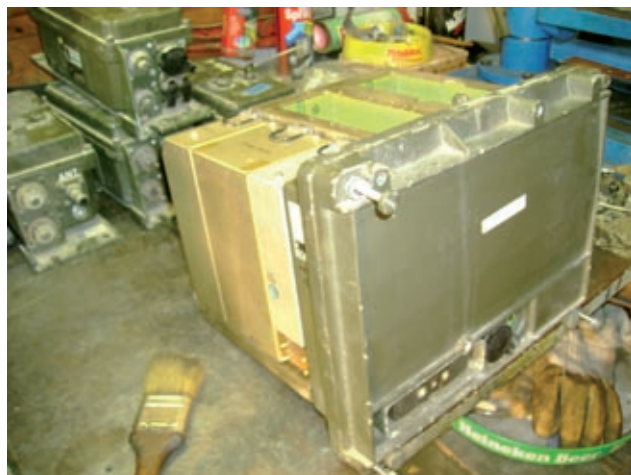
Inizio operazioni di pulizia