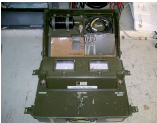
Test Set SEM-25 - Rosmetro/Wattmetro con accessori

i cavalieri del suo ATU; e il carico fittizio e la serie di cavetti intestati BNC e adattatori.