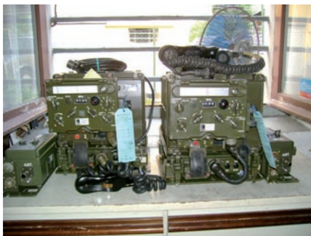
I SEM-25 finiti e provati. Una bella differenza vero?