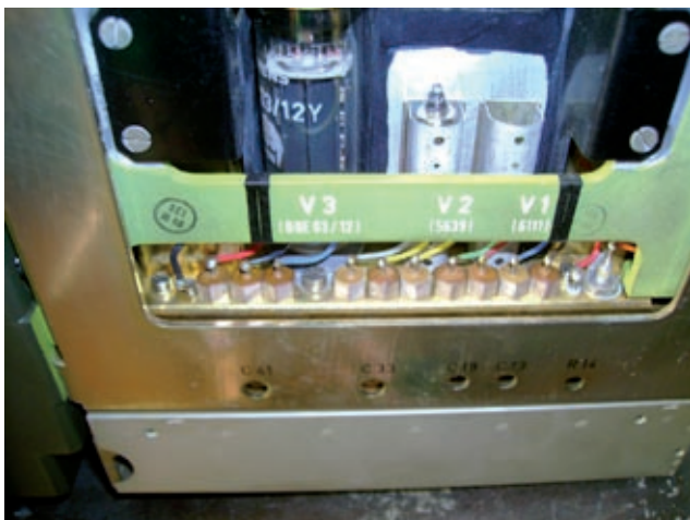
Valvole: Finale-Dryver e Modulatrice