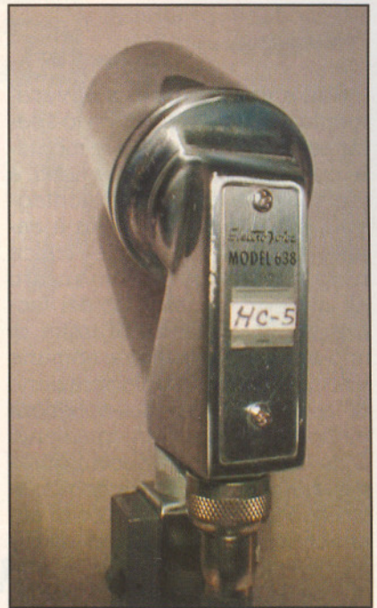
Foto 3 - Il microfono chiuso

Se l'uso è previsto su un ricetrasmittitore "non Icom" è necessario liberare un filo nel cavo che va alla radio (il nero è la massa del PTT, e può tranquillamente essere utilizzato) quindi sotto il coperchio che ripara lo switch del PTT è necessario inserire una resistenza da 1 k \Omega (1/4 W) collegata tra l'uscita del preamplificatore e i +8V provenienti dalla presa microfonica della radio, un elettrolitico da 10 \mu F tra i +8V e massa e in altro in serie al segnale microfonico verso il ricetrasmittitore. E' questa la parte di schema compresa nel "fumetto" a destra dello schema elettrico.