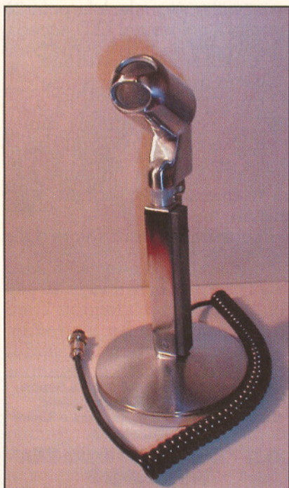
Foto 1 - ElectroVoice 638W

N on è mia intenzione presentare l'ennesimo schema di un preamplificatore... Si tratta di rendere nuovamente utilizzabile un microfono che l'evoluzione delle nostre apparecchiature ha di fatto reso inutilizzabile.