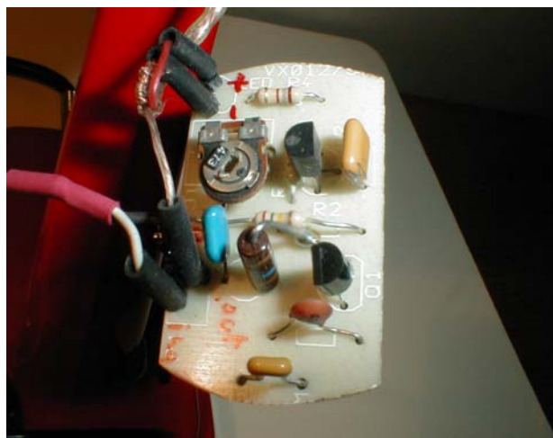
Figura 4 . Particolare del preamplificatore

L'alimentazione, fornita dal ricetrasmittitore, è generalmente compresa tra 5 e 8 V; il preamplificatore lavora ugualmente bene anche con tensioni maggiori. Con l'alimentazione