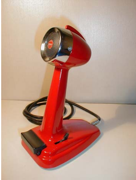
Figura 1 – Il microfono restaurato