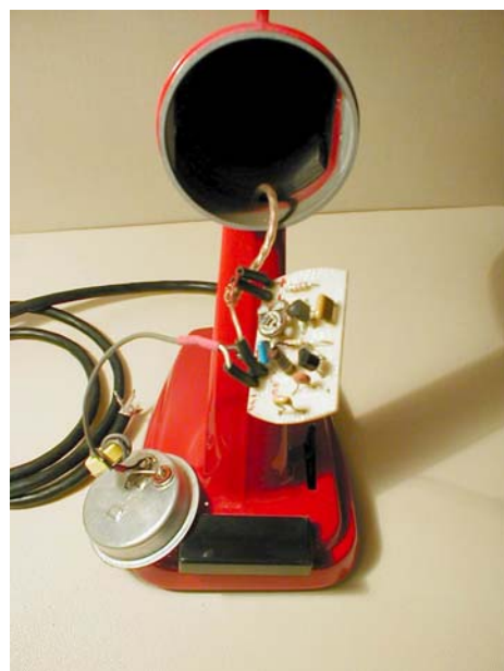
Figura 2 – Il preamplificatore montato nella testa del microfono

Il preamplificatore trova posto, così come nel +2, nella testa del microfono, dietro la capsula. La regolazione del livello è fornita da un trimmer, non da un potenziometro situato sulla parte posteriore della base, come era sul modello +2. Praticare un foro e montare la regolazione esterna significa modificare troppo l'estetica del 254c, per questo ho preferito la soluzione della regolazione semifissa all'interno della testa.