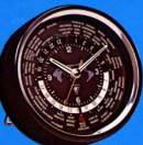
SOMMERKAMP Weltzeituhr QTR-24

Abmessungen: 370x157x350 mm Gewicht: 17 kg