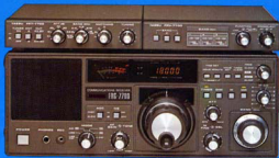
Sonderzubehör: FR1 7700 Antennen-Tuner FRV 7700C 140-170 MHz Converter FRA 7700 Aktive Zimmerantenne

Weich ein interessantes Hobby, die vielfältigen Funkdienste der Kurzwellen abzuhören: den Seefunk, Flugfunk, Polizeifunk, Amateurfunk und die Wetter- und Börsen Nachrichten und das Radioprogramm der entferntesten exotischen Länder im Direktempfang. Abmessungen: 334x129x225 mm Gewicht: 6,5 kg.