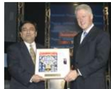
El premio "Stars of Asia"