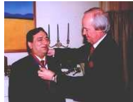
Orden Presidencial del Gobierno de Chile