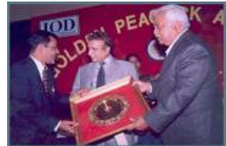
El Premio – “Golden Peacock”