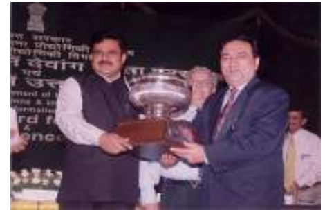
Dewang Mehta Award for Innovation in IT