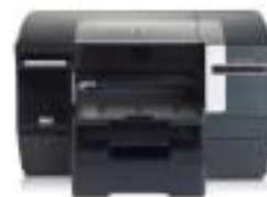
Impresora color HP Officejet Pro K550dtm