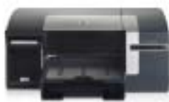
Impresora color HP Officejet Pro K550